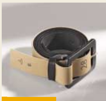
Obal na opasek použitelný jako věšák na šaty / Belt packaging that converts into hanger Audrée Lapierre