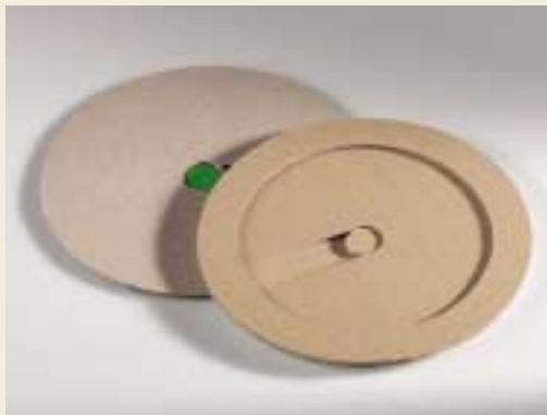
Obal na CD / CD case

Střední škola průmyslová a umělecká a Vyšší odborná škola / Secondary technical and arts school and Higher vocational school, Hodonín Česká republika / Czech Republic