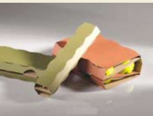
Obal na golfové míčky / Golf ball container

Akademia Sztuk Pięknych / Academy of Fine Arts, Gdańsk Polsko / Poland