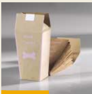
„Když je pryč apetýt, je pryč všechno“ – krabice, v níž jsou uloženy psí suchary / a „When appetite goes, everything goes- A box that gather together dog´s biscuits and dog´s dirt bags“ Sarah Belleville