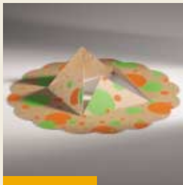
Legrační papírový klobouk / Funny paper hat Shany Bélanger