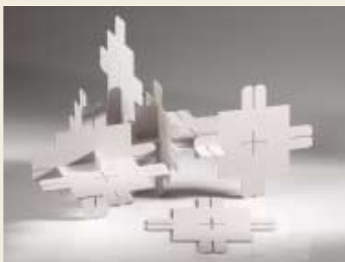
Stěna z lepenky / Cardboard wall

Střední uměleckoprůmyslová škola / Secondary School of Applied Arts, Uherské Hradiště Česká republika / Czech Republic