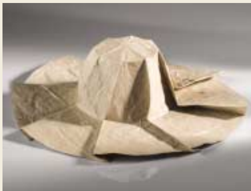
Kruh papíru kloboukem / Paper circle made hat