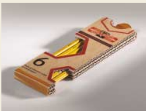
Prodejní kazeta KOOH - I - NOOR / KOOH - I - NOOR retail package

Střední škola průmyslová a umělecká / Secondary technical and art school, Opava Česká republika / Czech Republic