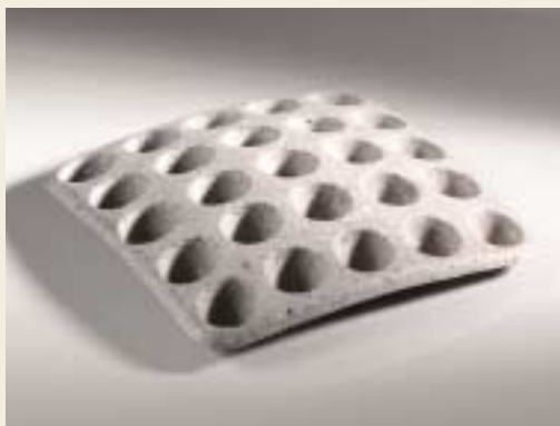
Podložka na vejce / Egg platter

Slovenská technická univerzita v Bratislave / Slovak University of Technology in Bratislava Slovensko / Slovakia