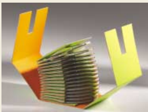
Stojan na CD / CD rack

Vyšší odborná škola grafická a Střední průmyslová škola grafická v Praze / Higher vocational school of graphic art and Secondary technical school of graphic art in Prague Česká republika / Czech Republic